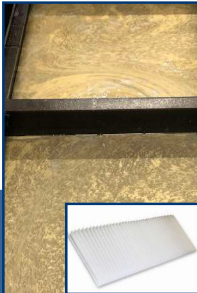
Behälter vor der Filtration

Die untenstehende Darstellung verdeutlicht den Vorgang und den Effekt des VITOs: