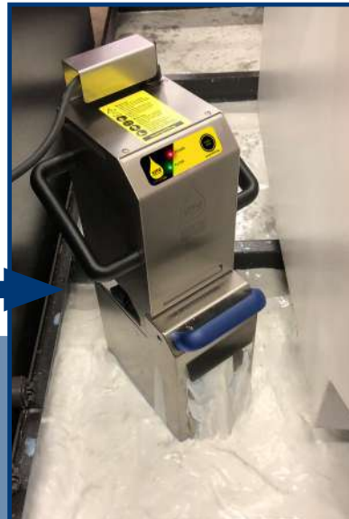
VITO belüftet, filtert und reinigt